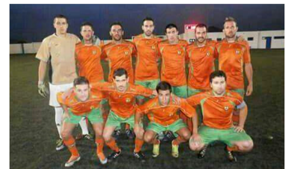
Equipo de fútbol regional del Haría CF.

Se informa a las personas que hayan realizado la pertinente inscripción en el Registro General del Consistorio de que la guagua saldrá el domingo, a las 05:00 horas, desde la parada de Máguez, pasando a continuación por Haría, Punta Mujeres, Arrieta, Mala y Guatiza,