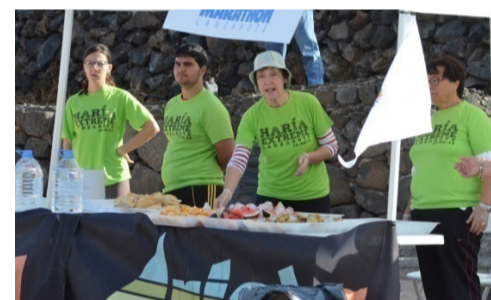
Grupo ganador del premio a la pamelita más original.