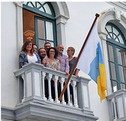
Levantamiento de la bandera nacional de Canarias en el Ayuntamiento

La moción fue aprobada este viernes en sesión plenaria