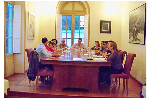
Sesión plenaria del Ayuntamiento de Haría.

Igualmente, la Ordenanza Fiscal Reguladora del Impuesto sobre Bienes Inmuebles establecerá a partir de ahora una deducción a favor de aquellos bienes en que se hayan instalado sistemas para el aprovecha-