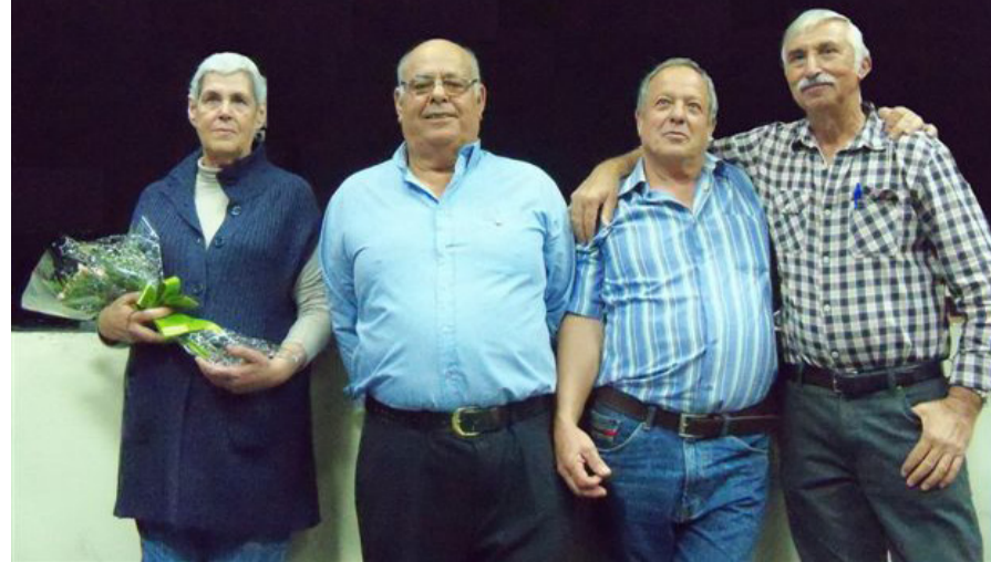
Trabajadores del Ayuntamiento jubilados