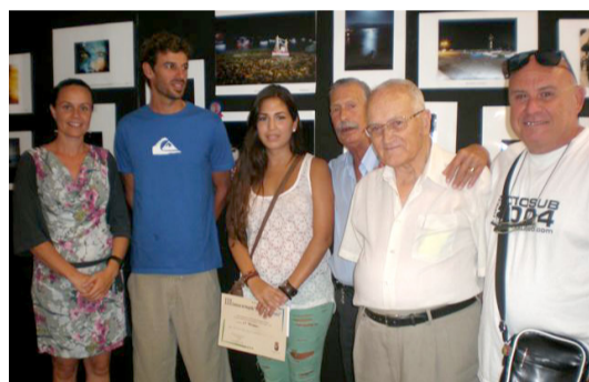
La concejala de Cultura, junto a la segunda premiada del concurso y los miembros del jurado.