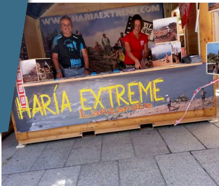
Stand informativo de la 'Haría Extreme' en la feria internacional de la 'UTMB', en Francia.

Las inscripciones se realizarán en las dependencias de la Escuela Municipal de Karate, situadas en la calle San Pedro 5 de Máguez, los lunes y miércoles, en el horario de las clases.