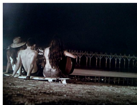
Segundo premio del concurso: 'Quédate un rato más'.