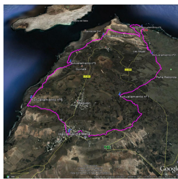
Haría Extreme Copa de España

Distancia: 32.5 km. Desnivel positivo: 1450 m. Desnivel negativo: 1450 m. Altura mínima: 5 m. Altura media: 240 m. Altura máxima: 640 m.