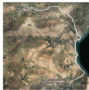
Haría Extreme Senderista

Distancia: 22.5 km. Desnivel positivo: 950 m. Desnivel negativo: 950 m. Altura mínima: 5 m. Altura media: 274 m. Altura máxima: 650 m.