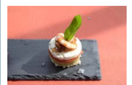
Restaurante La Nasa en Arrieta: Todos los días, de 12:00 a 20:30 horas. Tapa: Bocadito del Norte.