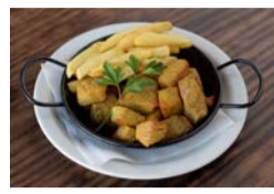
Los Roferos en Máguez: De martes a viernes, de 16:00 a 23:00 horas. Tapa: Atún en adobo.