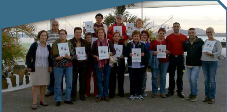
Mayores en la 3ª Semana de Prevención de Incendios en Lanzarote.