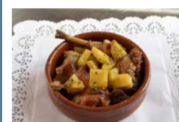
Boutique del Pan de Haría: Todos los días, de 10:00 a 14:30 horas. Tapa: Conejo al ajillo con papas.