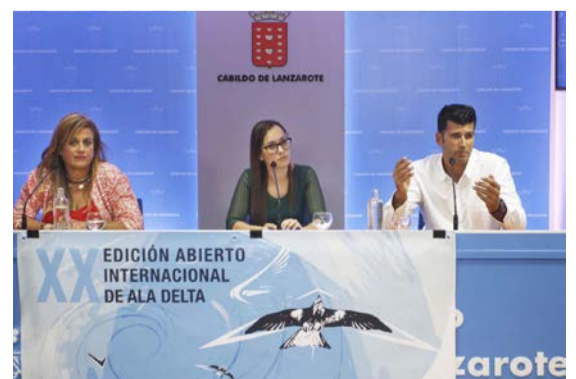
Presentación del 'Abierto Internacional de Ala Delta'.

La competición se está desarrollando en función de las condiciones climatológicas, con cuatro puntos de salida previstos según sea la dirección del viento: Risco de Famara, La Asomada, El Cuchillo y la Presa de Mala.