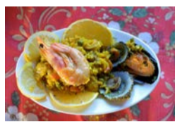
Arepera de Mala: Martes y miércoles, de 13:30 a 18:00 horas. Tapa: Paella.