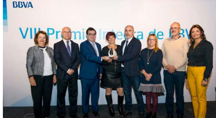
Foto de familia 'Premios Integra' de BBVA.

Antes se usaba por algunos más pudientes el reloj Roskopf Patent, de Cuervo y Sobrinos, traído de América, que usaban dentro de su vestido con chaleco, con una leontina.