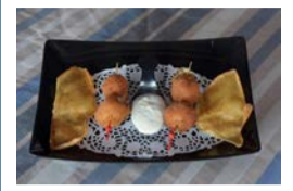
Restaurante La Gamba Loca en Órzola: Todos los días, de 10:00 a 19:00 horas. Tapa: Croquetas de higos y queso ahumado.