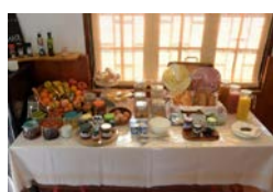
Teleclub de Tabayesco: De martes a domingo, de 09:00 a 13:00 horas. Tapa: Desayuno – buffet.

Las personas interesadas pueden consultar el programa en la web www.malabharía.com .