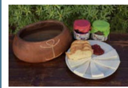
Pardelas Park en Órzola: Todos los días, de 10:00 a 18:00 horas. Tapa: Queso con mermelada.