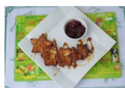
Bar Centro Democrático de Máguez: Todos los días, de 12:00 a 23:00 horas. Tapa: Mojito con mermelada de pimiento rojo y frutos del bosque.