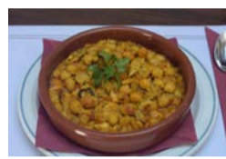
Bar Sociedad La Tegala de Haría: Todos los días, de 11:00 a 23:00 horas. Tapa: Garbanzos con pescado.