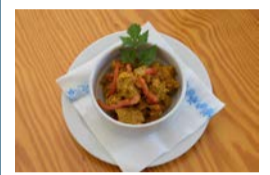
La Cantina de Mala: Bar Sociedad Renacimiento. Todos los días, de 11:00 a 21:00 horas. Tapa: pollo al curry.