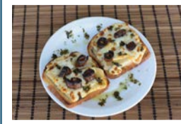
Pizzería Arrieta: Todos los días, de 13:00 a 16:00 y de 19:00 a 22:30 horas. Tapa: Pan del norte.