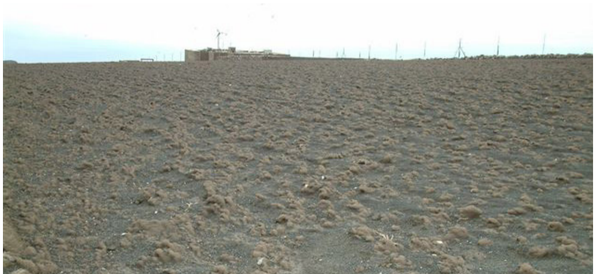
Situación de una finca del municipio tras el paso de la tormenta tropical Delta en 2005.

Muchas de las fincas afectadas han sido abandonadas por sus propietarios al no poder ponerlas en producción, lo que repercute no solo en la economía doméstica de las familias, sino también en el paisaje agrícola de la zona, de extraordinario atractivo.