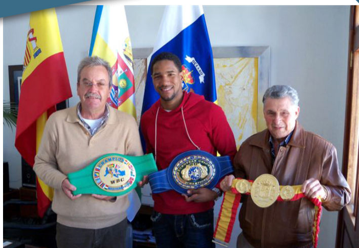
Alcalde de Haría con el 'Tiburón' y Palenke.