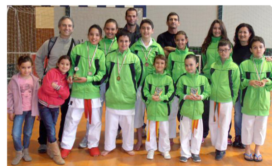
Alumnos de la Escuela Municipal de Karate

En la modalidad de kumite (combate) Azarug Gon-