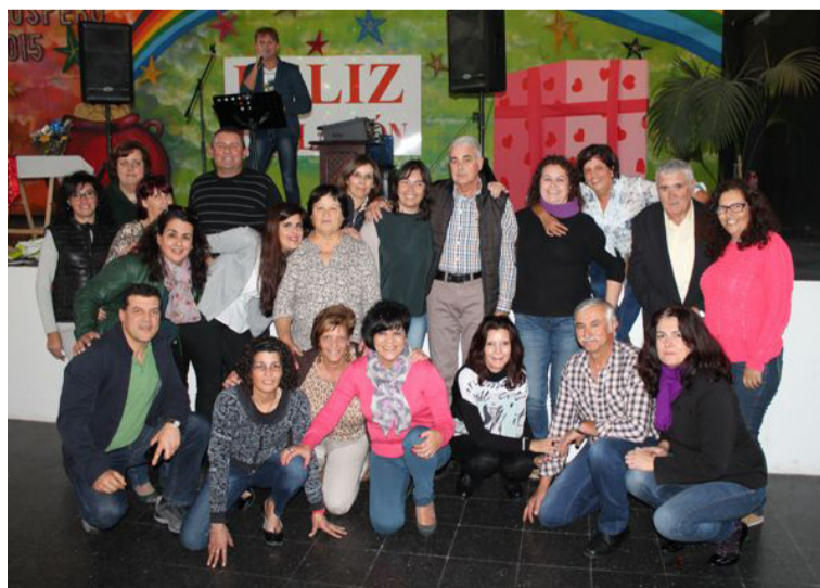
Trabajadores del ayuntamiento de Haría junto a los jubilados.