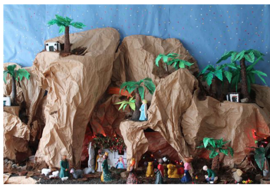
Primer Premio para el IES Haría.