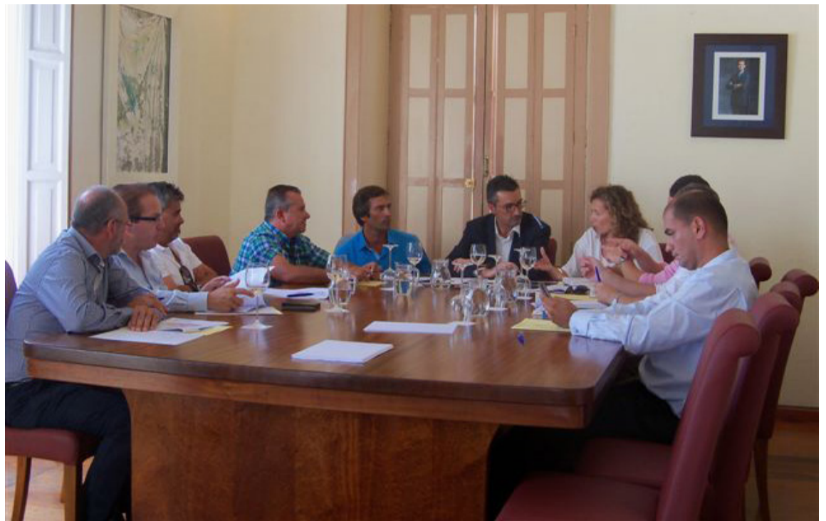
Mesa de trabajo sobre los aparcamientos de Órzola.

"Con éstas medidas", puntualiza el edil norteño, "encaminadas al desarrollo sostenible de nuestro municipio, ofreceremos a los vecinos la posibilidad de recuperar su derecho a observar las estrellas y a disfrutar de un cielo libre de contaminación lumínica, así como a conservar y proteger la calidad nocturna de nuestro cielo por considerarlo un importante recurso científico, cultural, medioambiental y turístico".