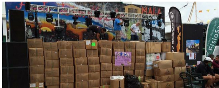
Tapones solidarios recogidos durante la prueba.