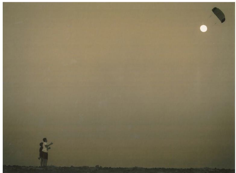
'La Cometa y la Luna', de Florencio Martín Melián.