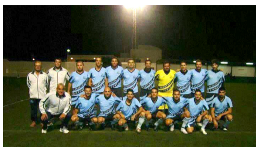
Jugadores de la ADC Costa Norte.

Desde el Ayuntamiento de Haría se felicita a