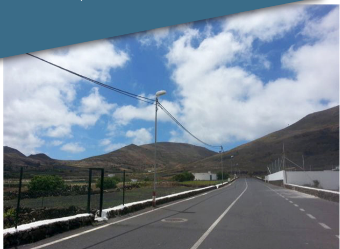
Nuevas farolas en la calle Andrés Luzardo 'Pollo de Máguez'.