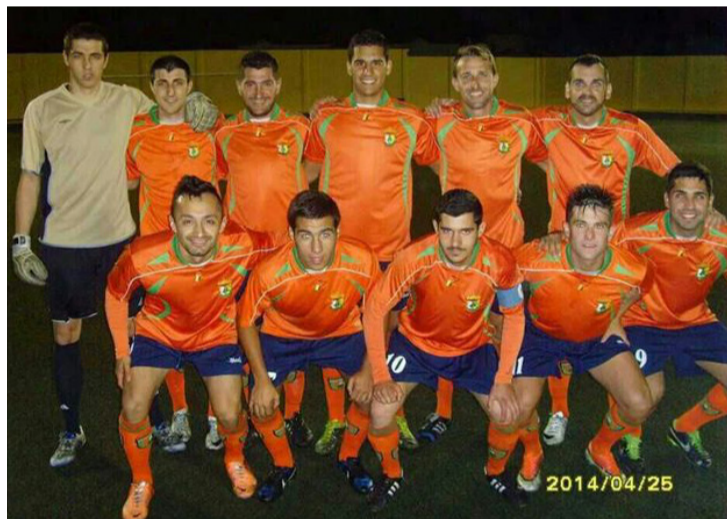
Miembros del conjunto regional del Haría C.F.-Rincón de Aganada.

Desde el Ayuntamiento de Haría se felicita a los componentes de ambos equipos, así como al equipo técnico y al club por estos nuevos reconocimientos deportivos que culminan una temporada cargada de mucho trabajo e ilusión.