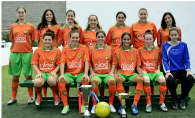
Equipo femenino del Haría C.F.-Rincón de Aganada.