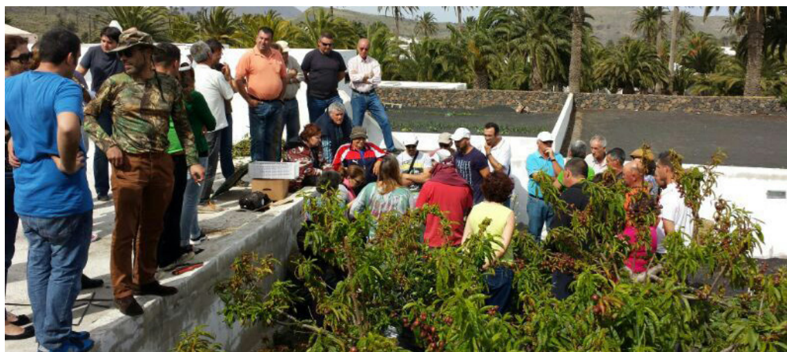
Participantes en las jornadas de compostaje doméstico.